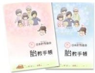
1.胎教手帳(妊婦/妊夫用) 90分×3回 ※商標出願中