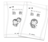
4.胎教講習 50 分 (導入編) ※2020 リニューアル