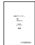
5.課題 1 冊 (実践中心 38 ページ)