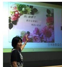
↑ 伝える手段を練習

胎教アドバイザー®Special 資格者証 サイズと厚みイメージは、 キャッシュカードぐらいです。