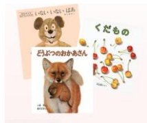
3.絵本 3 冊