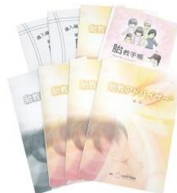
テキスト8種イメージ