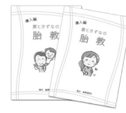
4.胎教講習 50 分 (導入編)