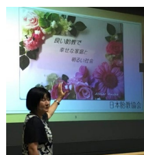
↑ 伝える手段を練習