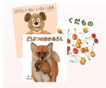
3.絵本 3 冊