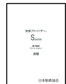
5.課題 1 冊 (実践中心 38 ページ)