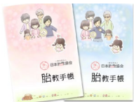
1.胎教手帳(妊婦/妊夫用) 90 分×3 回